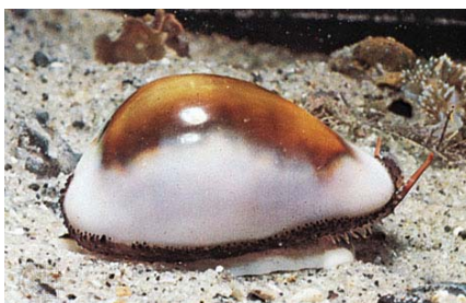
Cowrie in mediul natural

La multe triburi cochiliile de cowrie simbolizeaza feminitatea, fertilitatea, si se considera ca au puteri magice, protectoare pentru cel care le poarta, fiind utilizate in diverse practici ritualice.