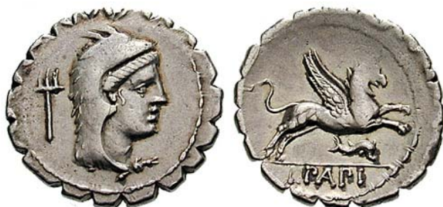
L Papius Denar 79 i.e.n - revers cu gryfon