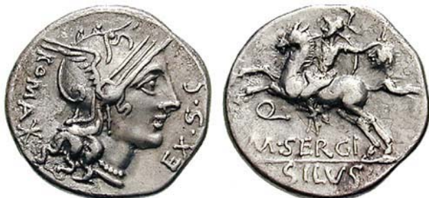
M Sergius Silus denar+ pe revers se poate observa calaretul tinand un cap taiat