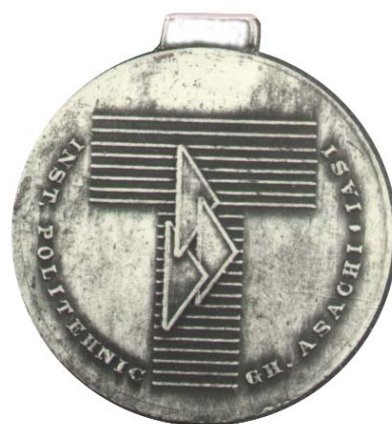
Fig. 2 av