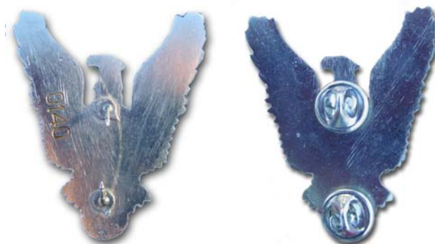
Revers insigne aripi varf drept 46,3mm/ 55,4mm/20,96g(cu serie); cu pini dar fara serie

Aplicarea este semiingropata in locul special creat in noua matrita. Pe spate acestea sunt la inceput inseriate, iar prinderea se face cu doi pini.