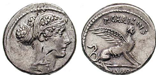
Denar T. Carisius 46 i.e.n - revers cu sinx