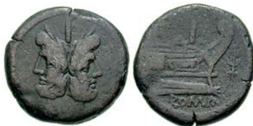
As republican anonim -206-195 i.e.n - avers Ianus