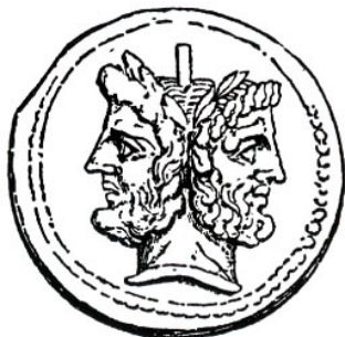
Reprezentare grafica a efigiei lui Ianus pe un as republican

Cele doua monede reprezentate pe avers sunt doi asi republicani , nominal ce purta cu predilectie pe avers efigia zeului Ianus, zeu din triada arhaica, alaturi de Marte si Jupiter. Ianus mai purta numele si de Quirinus. Quirinus era mla inceputuri un zeu al sabinilor. Acestia aveau un altar închinat zeului pe colina Quirinalis (sau Quirinal) una dintre cele sapte coline ale Romei de mai târziu. Când au venit romanii, au absorbit cultul lui Quirinus, si credeau ca el este de fapt Romulus zeificat. Se presupuneade asemenea ca Tibrul este fiul lui Ianus. Ianus era zeul tuturor inceputurilor si al trecatorilor, precum usi, poduri, sau porti. În timpul sacrificiilor, prima jertfa îi era închinata întotdeauna lui Ianus, si era numit primul în orice lista cu nume de zei. Chiar prima luna a anului a fost numita Ianuarius în cinstea sa, având ca sarbatoare ziua de 1 ianuarie. Ca particularitate a infatisarii , Ianus avea doua fete, purtând numele de Ianus Bifrons.