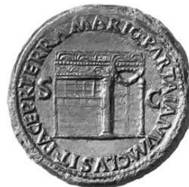
Nero, sestert - revers templul lui Ianus

Existau mai multe temple închinat lui Ianus în Roma, cel mai cunoscut fiind cel din For ,ale carui porti obisnuiau sa stea deschise în timp de razboi, si închise pe timp de pace. Ilustrativa în acest sens este o deosebita emisiune monetara de bronz a lui Nero, ce are reprezentat acest templu pe revers împreuna cu legenda: PACE P R TERRA MARIQ PARTA IANVM CLVSIT (Pace poporului roman pe pamânt si pe mare, portile lui Ianus au fost închise !). Aceste porti au mai fost inchise de doua ori înaintea sa, odata în timpul lui Numa Pompilius si a doua oara dupa primul razboi punic.