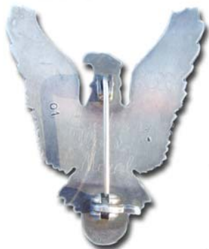
Revers insigna argint-46,3mm/55,4mm/34,5g

Prinderea se realizeaza cu agrafa si castanieta.