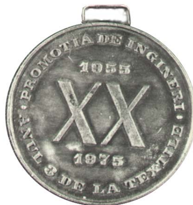
Fig. 2 rv

COLECTIONARUL ROMAN - revista online gratuita pentru colectionari, ISSN 1842 - 6069