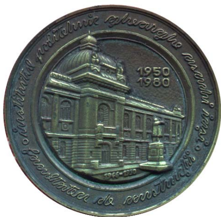
Fig. 1 av