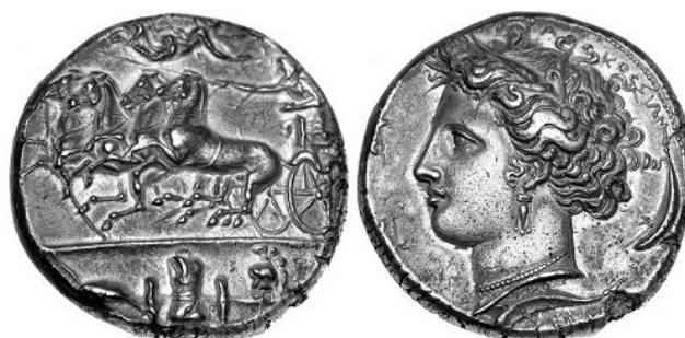
Syracusa - decadrachma Dionysios I, cca. 405-367BC

Perioada clasica a durat cam un secol si jumătate, de la razboaiele cu persii, pana la moartea lui Alexandru Macedon (323 BC), iar monedele grecesti acum ating nivelul tehnic si estetic cel mai ridicat. Majoritatea oraselor mari produc deja monede de aur si argint de buna calitate pe care apare portretul zeului sau zeitei protectoare, sau al unui erou legendar pe avers si un simbol al orasului pe revers. De exemplu o serie de monede deosebite au fost emise de orasele bogate din Sicilia, decadrachma din Syracuse fiind considerata de majoritatea colectionarilor de monede antice ca poate cea mai frumoasa moneda antica.