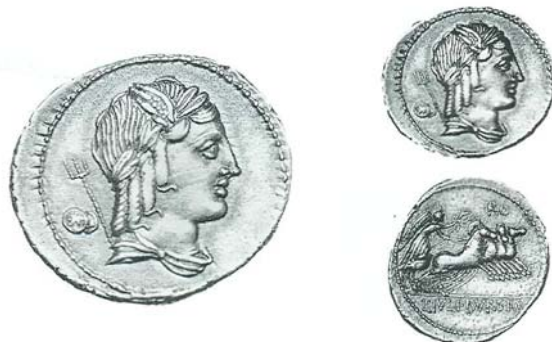
Denar Iulius Bursio - 85 i.e.n- pe avers apar doua monede republicane

Între toate reprezentarile aflate pe monedele romane una singura am gasit-o de un interes aparte, care merita o descriere mai detaliata în acest articol. Desi este cunoscut faptul ca prima monetarie romana a fost înfiintata în templul zeiței Iuno Moneta, zeita ce mai apare reprezentata din când în când pe monede, totusi, exponentul economic al acelor vremi, obiectul constitutiv al schimburilor si al platilor , moneda, nu prea apare reprezentata în imagistica monetara. O exceptie o reprezinta urmatorul denar al magistratului Iulius Bursio, din anul 85. i.Hr.: