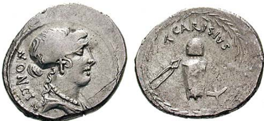
Denar T. Carisius 46 i.e.n - pe revers nicovala, ciocan, cleste

Între toate reprezentarile aflate pe monedele romane una singura am gasit-o de un interes aparte, care merita o descriere mai detaliata în acest articol. Desi este cunoscut faptul ca prima monetarie romana a fost înfiintata în templul zeiței Iuno Moneta, zeita ce mai apare reprezentata din când în când pe monede, totusi, exponentul economic al acelor vremi, obiectul constitutiv al schimburilor si al platilor , moneda, nu prea apare reprezentata în imagistica monetara. O exceptie o reprezinta urmatorul denar al magistratului Iulius Bursio, din anul 85. i.Hr.: