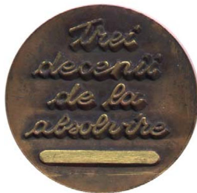
Fig. 1 rv