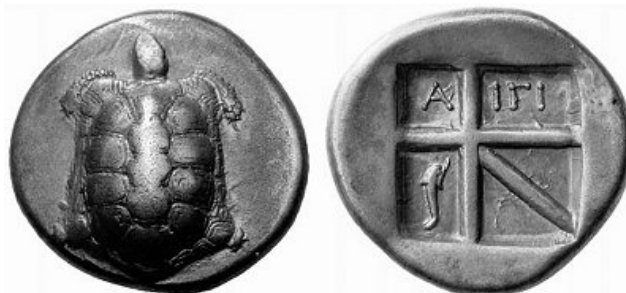
Stater de Aegina 350-338BC

In aprox. 510 BC Atena a inceput sa emita o moneda de argint de 4 tetradrachme de foarte buna calitate. Cum Atena si Aegina au fost rivale, tetradrachma de Atena a fost batuta in standard diferit, cel Atic, cu drachma la 4.3 grame. De-a lungul timpului datorita intensificarii dominatiei ateniensilor in comert si marii cantitati de argint extrasa din minele de la Laurion, sistemul Atic a devenit cel dominant. Aceste tetradrachme in sistem Atic au avut o larga utilizare si in perioada urmatoare, cea clasica.