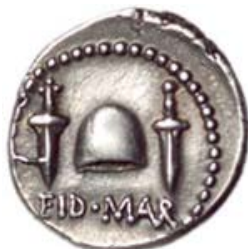
Denar Junius Brutus- comemoreaza idele lui martie

Nu în ultimul timp sa ne amintim de celebrul denar al ui Brutus cu EID MAR ce comemoreaza asasinatul dictatorului Iulius Caesar, denar ce poarta pe o fata doua pumnale, unelte folosite la asasinat.