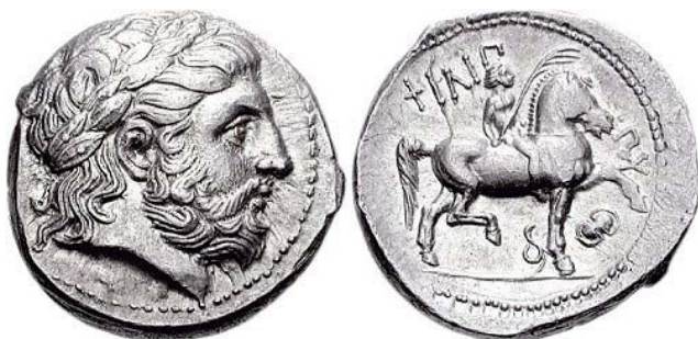
Tetradrachma Philipus II, 359-336BC

Au mai aparut totusi cateva exemple superbe de arta numismatica greceasca, cum ar fi cea mai mare moneda antica de aur - piesa de 20 stateri al lui Eucratides I, si cea mai mare moneda antica de argint, decadrachma dubla al lui Amnytas. O noutate ar fi aparitia pe monede a efigiilor unor persoane in viata, si anume a regilor. Aceasta practica a inceput in Sicilia, dar a fost dezaprobat de multe orase grecesti. Nu acelasi lucru s-a intamplat si in Egiptul Ptolemaic si in regatul Seleucid din Syria, unde au fost emise monede de aur foarte frumoase cu efigiile conducatorilor pe avers si simbolurile de stat pe revers. Numele regilor a fost deasemenea inscriptionat pe monede.