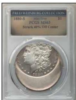
1880-S Morgan Dollar -- Struck 40% Off Center -- MS63 PCGS $72,000.00

Mint Error News Magazine trece în fiecare ediție în revistă soldurile obținute la vânzări ale pieselor cu eroare, un exemplu aleatoriu fiind prezentat mai jos: